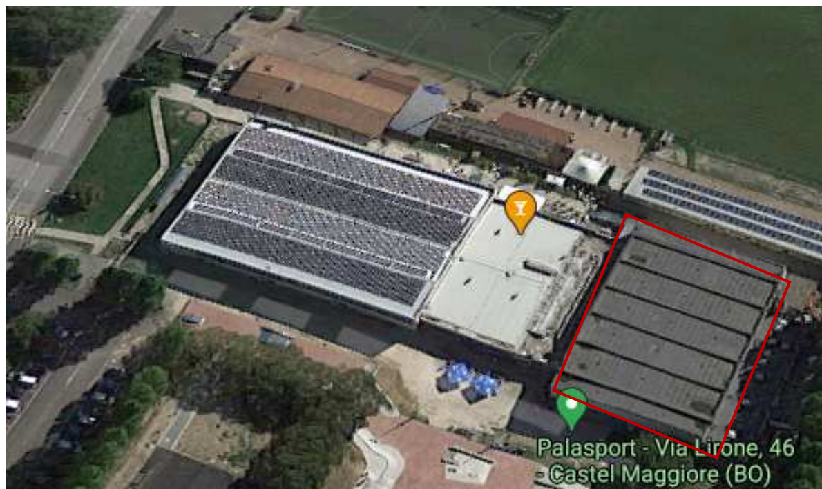
Vista satellitare 3D